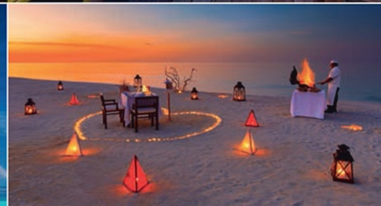
Beach Villen mit privatem Strandzugang